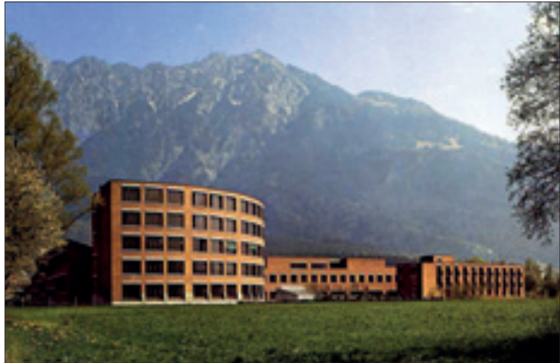
Neues Liechtensteinisches Gymnasium 1972

Eine Reihe von Brüdern war auch in Italien im internationalen Juvenat (Grugliasco) und Noviziat (San Mauro) tätig. Die Gründungen in Ungarn hatten aus politischen Gründen keinen Erfolg und die drei Internate in Österreich mussten nach dem Einmarsch der Nazis auch bald wieder geschlossen werden. Nun wurde ein neues Missionsfeld in Südamerika, in Uruguay, eröffnet. Ab 1937 reisten immer mehr deutsche Brüder dorthin, um eine Reihe von Schulen zu gründen.