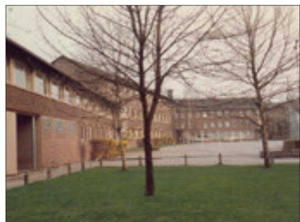
Recklinghausen – Maristenschule

Aber dann kam in der Zeit der großen Krise ab Ende der 60er Jahre auch der große Einbruch in Deutschland durch viele Austritte und Mangel an Berufen. Die Zahl der im Dienst der Erziehung tätigen Brüder wurde immer ge-