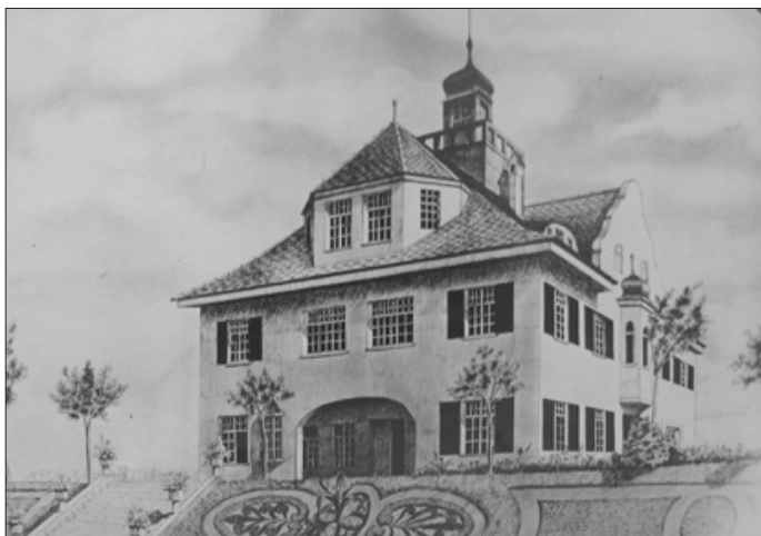
Villa in Furth

Nach 1919 kam es in der Entwicklung des seit 1920 zum Distrikt erhobenen Zweiges der MaristenSchulbrüder in Deutschland zu einem großen Aufschwung. Schnell wurden Schulen, Internate und Waisenhäuser als neue Wirkungsstätten für das Apostolat übernommen. Die Zahl der Brüder stieg weiter an. In Furth