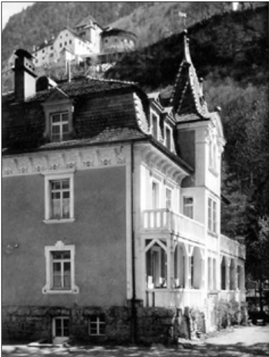
Villa Blanca – Erstes Haus 1937

durch die kirchenfeindliche Regierung wurde immer massiver, bis schließlich durch Gesetz 1936 die Schließung aller Einrichtungen in Bayern und später auch in Remagen und Recklinghausen erfolgte. Etwa 150 Brüder verloren ihre Beschäftigung und mussten neue Arbeitsfelder im Ausland suchen. Eine Gründung in Dänemark war bereits früher erfolgt. Nun wurden neue Niederlassungen in den Niederlanden, in der Schweiz, in Polen und vor allem im Fürstentum Liechtenstein gegründet.