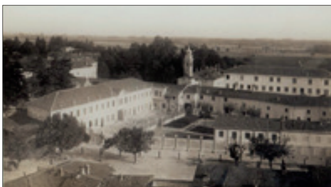
Giubiasco nahe Turin: Mutterhaus

Daneben war er auch noch mehrere Jahre Verwalter und Direktor des Mutterhauses selbst. Infolge der guten Kontakte mit seinen früheren Schülern, die vor allem in Brasilien, China, Südafrika und Australien tätig waren, war er einer der best informierten Kenner der Kongre-