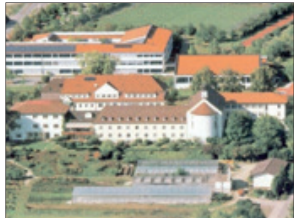
Kloster und Maristen-Gymnasium