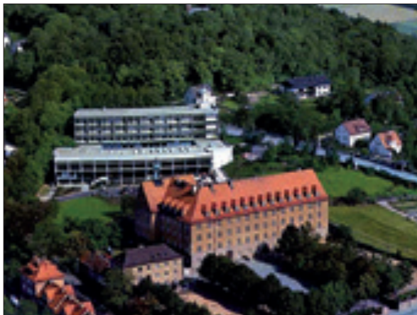
Cham: Internat und Realschule

1946 erfolgte die Erhebung zur Ordensprovinz, ein Zeichen aus dem Mutterhaus für den Anstoß zu einem neuen Aufschwung. Stationen des Aufschwungs waren die Errichtung eines Studienhauses in München, der Neubau der Klosterkirche und des Brüderhauses in Furth, der Neubau der Schule in Recklinghausen und vor allem der Neubau der Schule in Mindelheim 1961 und die späteren großen Erweiterungsbauten. Auch Cham erhielt 1966 eine neue Schule, und schließlich 1995 auch Furth. Die Zahl der Brüder, war 1967 auf 187 angewachsen. Die Internate und Schulen blühten.